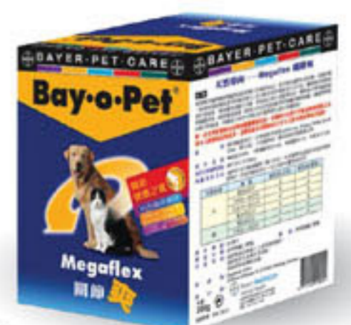
■ 關節與一關節營養保健食品 可以提供寵物關節軟骨修復，增加軟骨液生成與減輕疼痛。粉狀餵食，免受餵食藥錠的痛苦。