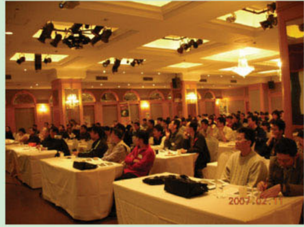
■來自南部七縣市的臨床醫師，專心吸收課堂醫學新資訊。