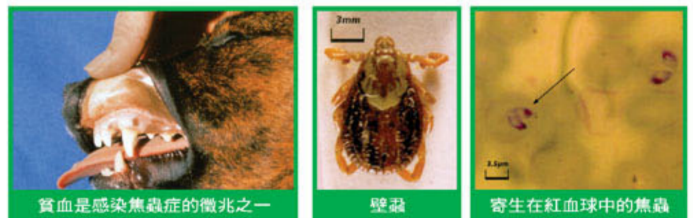
貧血是感染焦蟲症的徵兆之一

接下來的防護措施，每天或是當出外散步結束時，可以藉觸摸寵物全身，除了建立親暱情感外，順便可以檢查寵物身上是否有壁蝨寄生，如果有發現蟲體，避免使用雙手移除，建議使用夾子或鑷子夾除蟲體。最後，寵物定期洗澡與居住環境的清潔也是減少壁蝨出現與存活率的方式喔。